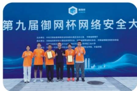
御网杯信息安全大赛省一等奖3项、 省二等奖7项、省三等奖10余项