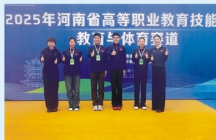
2025年河南省高等职业教育技能大赛“教育与体育赛道”省二等奖