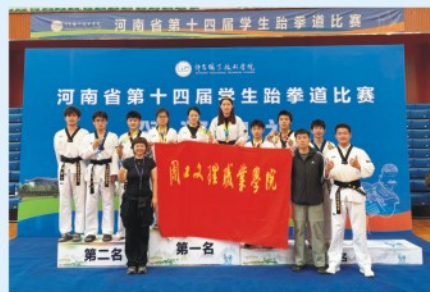
2025年河南省第十四届学生跆拳道比赛甲组、乙组双冠军