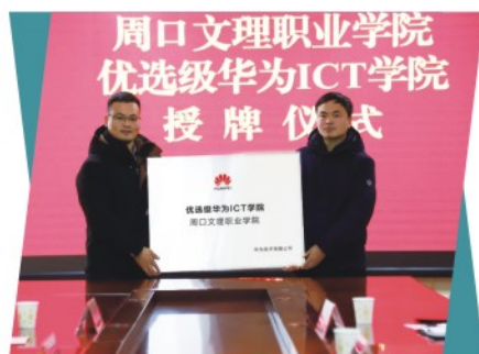
校企携手共育ICT人才

政府机关、企事业单位的信息管理人员、Web系统开发设计与维护、网络建设与维护、软件应用开发、IT行业售前售后支持人员、软件生产企业的产品测试岗位、计算机网络供应商的设备营销和技术支持岗位群、网络技术管理岗位群。