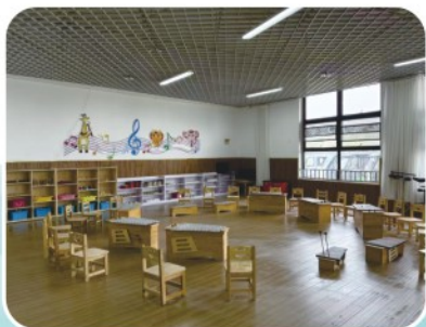
奥尔夫音乐实训室