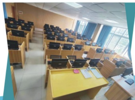
大数据技术应用实训室

政府机关、企事业单位，面向大数据工程技术人员、数据分析处理工程技术人员、信息系统运行维护工程技术人员等职业，大数据实施与运维、大数据分析可视化等技术领域。