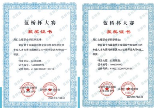
蓝桥杯大赛一等奖、二等奖