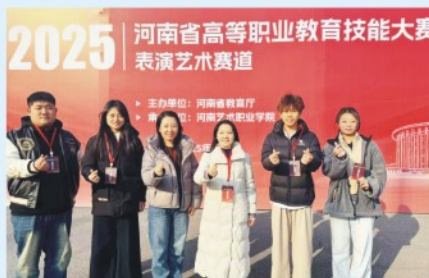
2025年河南省高等职业教育技能大赛“表演艺术赛道”省二等奖