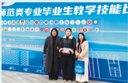
2025年河南省高等学校师范类毕业生教学技能比赛省一等奖