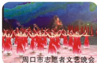
周口市志愿者文艺晚会

歌唱演员、钢琴教师、音乐教师、幼儿园教师、声乐老师等工作；乐器演奏员、小学艺术学校、音乐教育培训机构等单位的教师和管理人员、群众文化活动服务人员等其他教学人员；影视传媒公司、文教事业单位、音频后期制作、钢琴调律、从事教学科研、网络音乐新媒体相关工作。