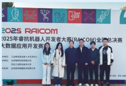
2025年睿抗机器人开发者大赛(RAICOM)全国总决赛大数据应用开发竞赛项目国家二等奖