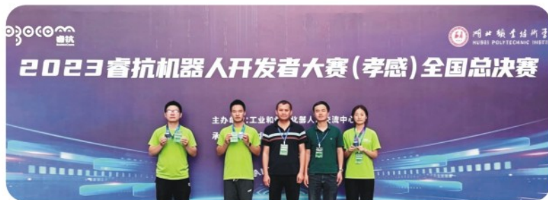
2023年9月荣获“2023睿抗机器人开发者大赛 (RAICOM) 全国总决赛”魔力元宝竞赛项目二等奖

工业互联网开发工程师、工业互联网实施架构工程师、工业互联网网络架构工程师、工业互联网平台运营主管、工业大数据工程师、工业互联网安全架构师。