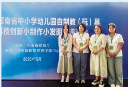
2025年第二十二届河南省中小学幼儿园自制教(玩)具暨学生科技创新小制作小发明评选活动省二等奖